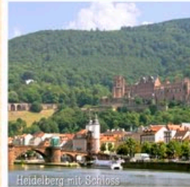
Heidelberg mit Schloss