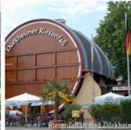
Riesenfaß in Bad Dürkheim